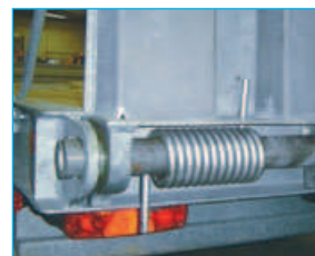
Aide au relevage des rampes.

Freinage pneumatique conforme à la directive CE 98/12. Rattrapage automatique d'usure des garnitures de freins. ABS de série fonctionnant sur la prise ISO 7638 si le véhicule tracteur est équipé d'ABS. Dans le cas contraire, déclenchement par les feux stop !