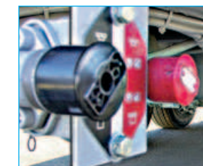
Frein de parc à commande pneumatique.

LES PLUS "SÉCURITÉ" EN HARMONIE AVEC LA REGLEMENTATION CE