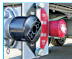
Frein de parc à commande pneumatique.

LES PLUS "SÉCURITÉ" EN HARMONIE AVEC LA REGLEMENTATION CE