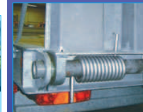
Aide au relevage des rampes.