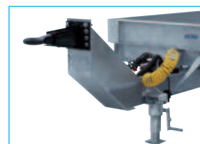
Anneau réglable en hauteur 750 à 900 mm.