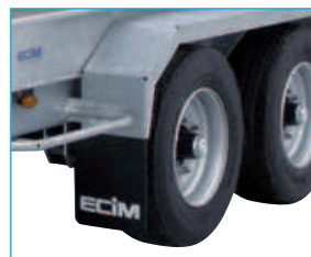
Les bavettes de protection captent l'eau projetée par les pneumatiques et en redirigent plus de 70% vers le sol, à l'abri des turbulences.