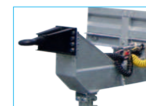
Anneau réglable en hauteur 750 à 900 mm.