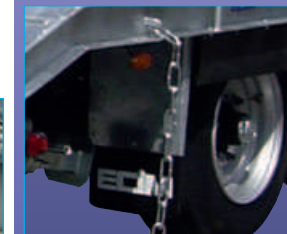
Les bavettes de protection captent l'eau projetée par les pneumatiques et en redirigent plus de 70% vers le sol, à l'abri des turbulences.