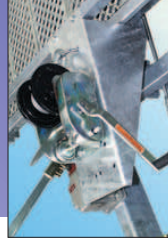
Treuil et support treuil.