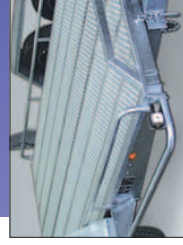
Fond complet caillaboits. Sauf sur PV Eco.