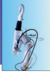
Timon articulé, sauf sur PV Eco.