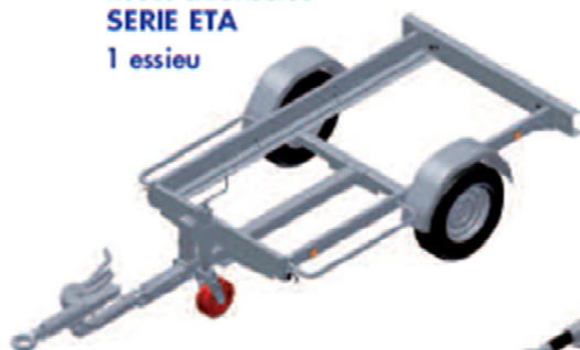
Roues extérieures SERIE ETA 1 essieu