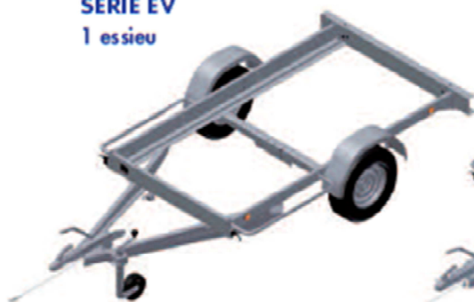
Roues extérieures SERIE EV 1 essieu