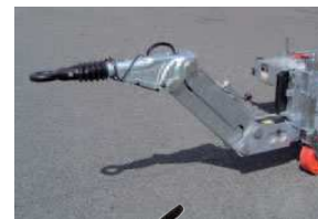
Option timon articulé avec compensateur d'effort