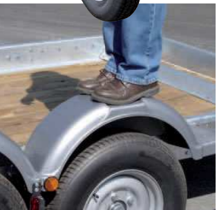
Garde-boue polyéthylène renforcés.